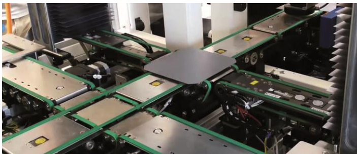
Inline-Charakterisierung: Wafer werden anhand vordefinierter Algorithmen oder Messergebnisse sortiert.